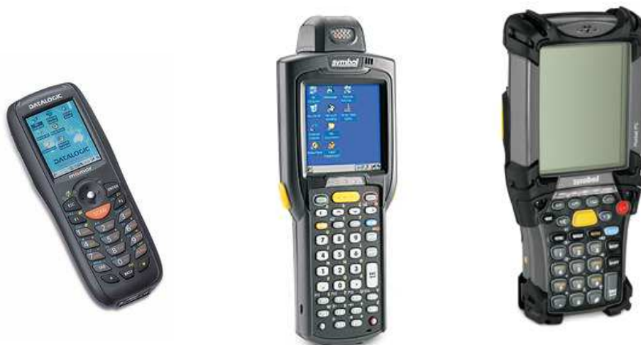
Abb. 2: Verschiedene Modelle mobiler Datenerfassungsgeräte

Manuelle Eingabefehler werden reduziert, die Erfassung und Übertragung der Daten erfolgt ohne Verluste und Sie haben keine Übertragungsfehler – somit wird insgesamt auch die Qualität Ihrer Daten gesteigert.